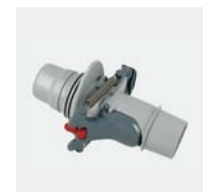
Automatisches Durchflussregelventil (Skimmer)