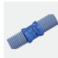
12 Twist Lock Schläuche